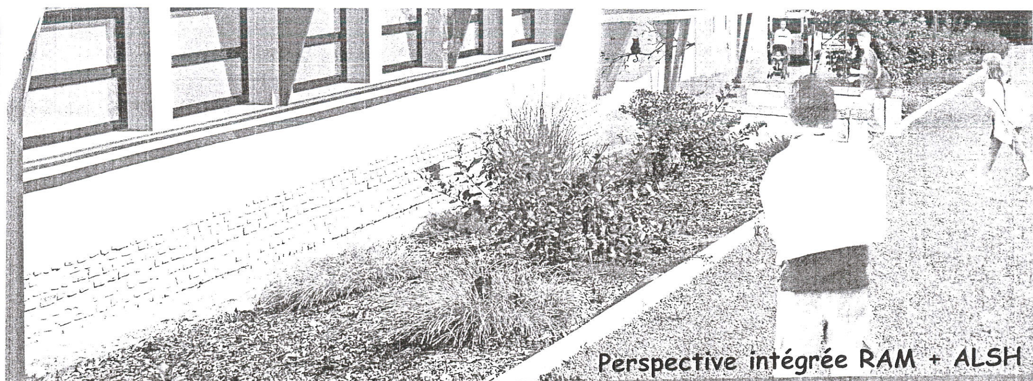
Perspective intégrée RAM + ALSH