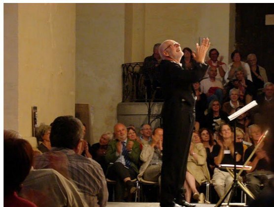
Itinéraire Baroque Samedi 6 juin— Collégiale Notre Dame

Abri d'Art : Exposition « Peintures Sculptures » Rita Vickery. Jusqu'au 07 juin. Les samedis et dimanches de 14h à 18h. (Rens. 06 08 80 32 04 / 05 53 90 35 73)