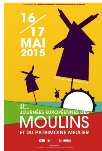
Moulins de St-Méard de Dronne, Montagnier, Lisle, Celle et Cercles-La Tour Blanche, Champagne et Fontaine (Programme disponible à l'OT De Ribérais)