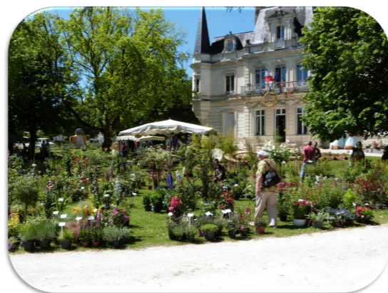
Floralies à Montagnier le 8 mai et à Ribérais le 16 & 17 mai 2015

Abri d'Art : Exposition « Céramiques Peintures » Lisbeth de Jonge. Jusqu'au 07 mai. Les samedis et dimanches de 14h à 18h. (Rens. 06 08 80 32 04 /05 53 90 35 73)